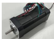
ブラシレスDCモータ