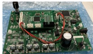
Renesas製モータ評価ボード